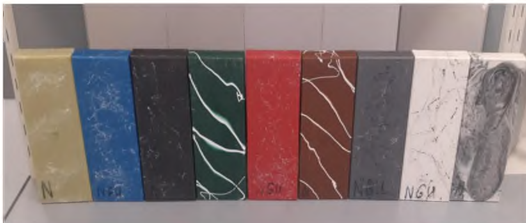
Рис. 1. Искусственные декоративные камни