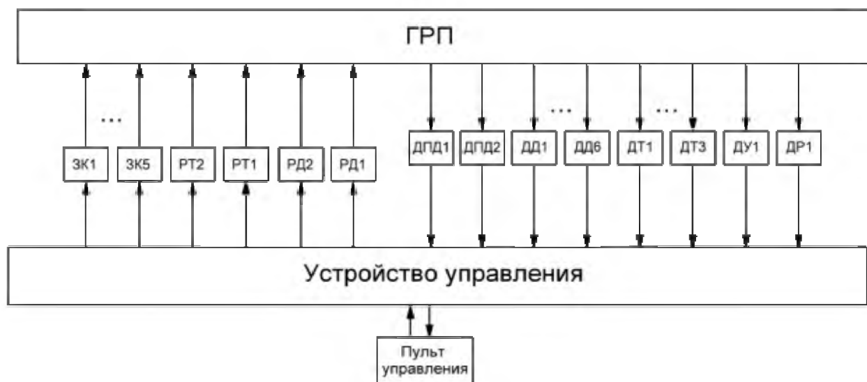
Рисунок 2 – Структура системы управления ГРП

На основании структурной схемы разработана функциональная схема автоматизации, которая содержит в себе 6 контуров регулирования (рисунок 3).